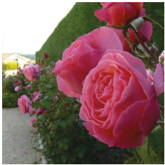
La commune de Chamboeuf a développé son identité autour de la Rose Meilland.