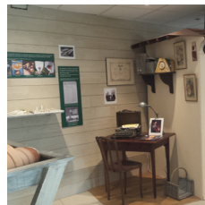
La Maison de la Rose 8