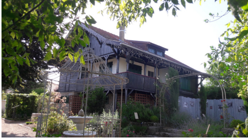
Le chalet de la Rose dans le jardin des senteurs 6

Remontez ensuite jusqu'au chalet. Entrez dans le jardin des senteurs 6 .